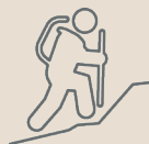
Trekking o passeggiate